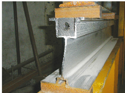
AFTER TEST / DESPUES DE