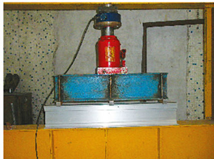
TESTING / PRUEBAS