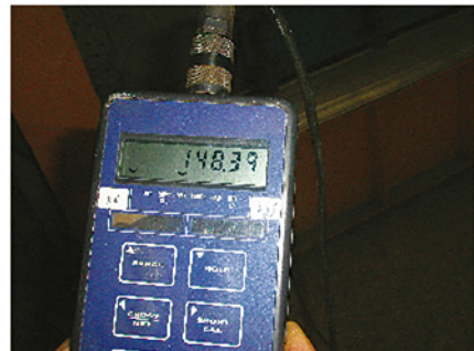
READING / LISTO