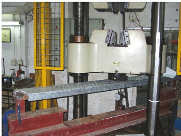
TESTING / PRUEBAS